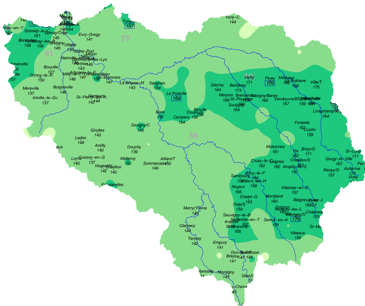
Rapport à la normale (%) – Réf : 81-2010

EN 4 MOIS : de OCTOBRE 1981 à JANVIER 1982